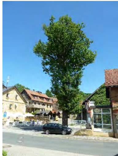
Abb. 6c: Siegesseiche in Gesees