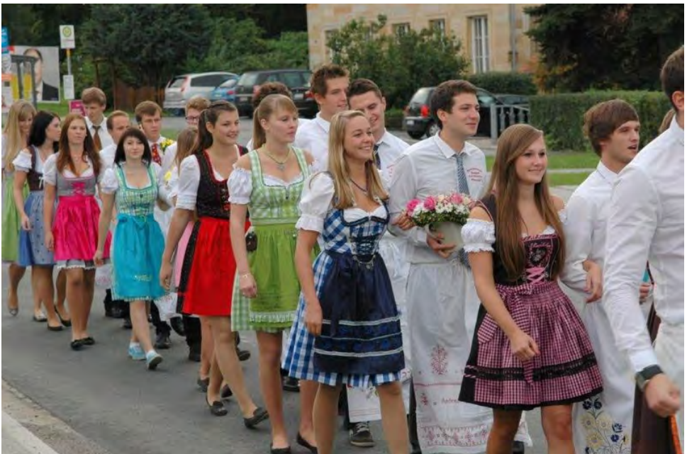
Einmarsch der Mistelgauer Kerwapaare

Beim Plantanz wurde zum Aufspielen eine extra Bühne aufgebaut. Auf dieser quadratischen Bruck nahmen auch die Kerwamusikanten Platz. Vorher waren sie der Schar der Burschen und Mädchen vorausgegangen, bevor kurz vor dem Platz die fröhliche Meute an ihnen vorbeihüpfte, um auf der Bruck (heute Dorfplatz) einen großen Kreis zu bilden. Die „Aufspiel“-Zeremonie konnte beginnen.