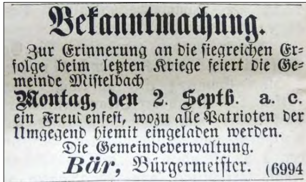
Abb. 4: Einladung zum „Freudenfest“ in Mistelbach als Siegesfest (Bayreuther Tagblatt vom 31. August 1872)

des deutschen Kaisers und unseres Königs Ludwig II. in je einem „Hoch“ gedacht worden war, wurde die Feier mit Absingen der Nationalhymne geschlossen und Jung und Alt ergötzen sich während der Nachmittagsstunden auf dem Festplaste [sic!] durch Tanzunterhaltung.“ (Bayreuther Tagblatt v. 5.9.1972, S. 2).