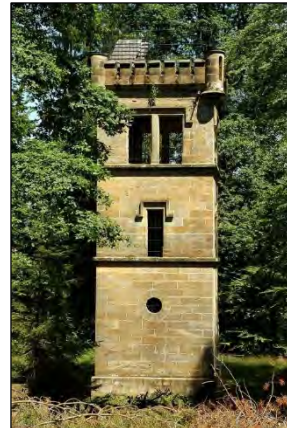
Abb. 3: Eckersdorfer Siegesturm

Der Herzog war offenbar ein glühender Patriot. Er ließ den Eckersdorfer Siegesturm 1874 in Sichtweite zu seinem Schloss Fantaisie errichten. Im Turm ist eingraviert: „Dem Andenken des glorreichen Friedens nach den siegreichen Kämpfen des deutschen Heeres in den denkwürdigen Jahren 1870/1871“ .