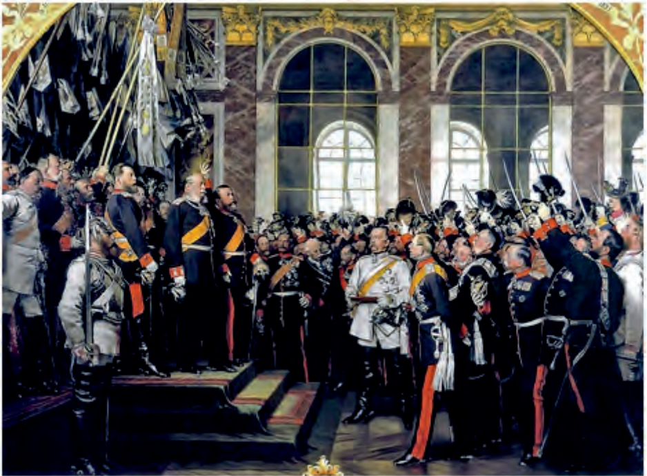
Kaiserproklamation im Spiegelsaal von Versailles am 18. Jan. 1871 (Gemälde von Anton v. Werner)