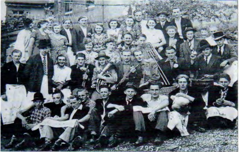
Die Aufnahme aus dem Jahr 1951 zeigt die damaligen Kerwaburschen und -madia mit den Mistelbacher Kerwa-Musikanten. Darunter noch einige heute lebende Teilnehmer.