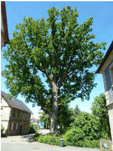
Abb. 6b: Friedenseiche in Pittersdorf