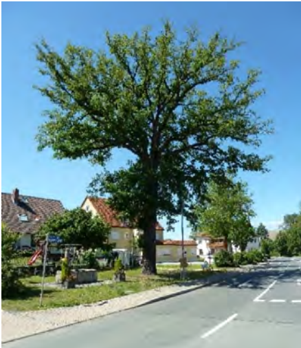
Abb. 6a: Wilhelmseiche in Pettendorf

Hinsichtlich ihrer Größe sind die Siegesseichen (wenn sie noch existieren) mittlerweile zu stattlichen Bäumen herangewachsen. Sie besitzen heute den Status von Naturdenkmälern und sind auch als solche schützenswert. Ergänzend sei jedoch nochmals betont, dass es auch und besonders an die historisch-kulturelle Vergangenheit, die mit diesen Bäumen verbunden ist, zu erinnern gilt. Die Siegesseichen sind somit kombinierte Kultur- und Naturdenkmäler.