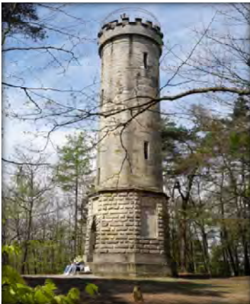
Abb. 2: Bayreuther Siegesturm auf der Hohen Warte

Ein untypisches Beispiel für einen Siegesturm stellt der Eckersdorfer Siegesturm im Geigenholz dar. Nicht nur, dass er nicht in einer Stadt, sondern am Rand eines Dorfes errichtet wurde. Auch die Finanzierung des Gebäudes wurde durch eine einzige Person, nämlich durch den Herzog Alexander von Württemberg, sichergestellt. Dieser residierte als Eigentümer von Schloss Fantaisie mit Park im Sommer in Donndorf und im Winter in seiner Bayreuther Stadtwohnung.