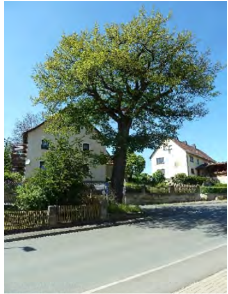
Abb. 6e: Sedanseiche in Mistelgau