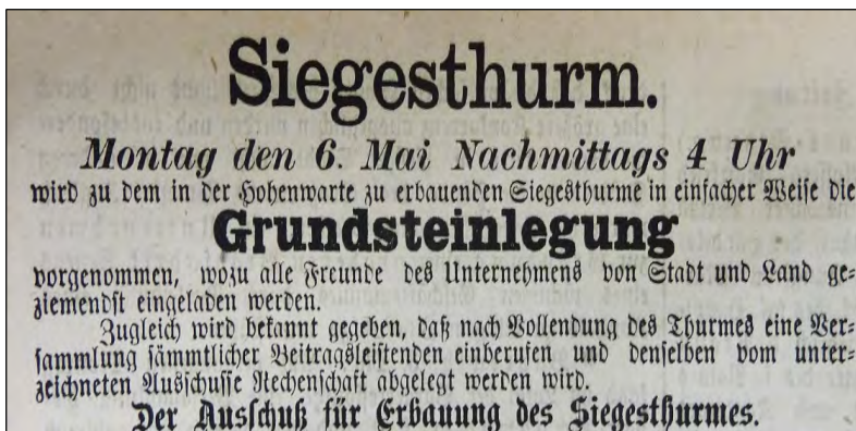
Abb. 1: Einladung zur Feier der Grundsteinlegung des Siegesturms Bayreuth (Bayreuther Tagblatt vom 4. Mai 1872)

Schon am 6. Mai 1872 erfolgte die Grundsteinlegung (Abb. 1) für den Bayreuther Siegesturm . Im Bayreuther Tagblatt vom 8. Mai 1872 wird berichtet von der „Feierlichen Handlung“ der Grundsteinlegung. Der Festredner „gab in beredten schwungvollen Worten eine gedrängte Uebersicht der Geschichte der Entstehung dieses Siegesdenkmals und verlas die in den Grundstein einzulegende, die ganze große Zeit der glorreichen Jahre 1870/71 schildernde Stiftungsurkunde [...]“.