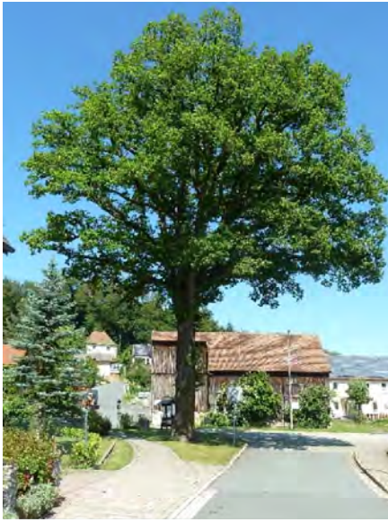
Abb 6d: Friedenseiche in Obernsees